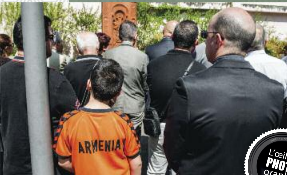
Cérémonie du 24 avril devant le khatchkar du Village